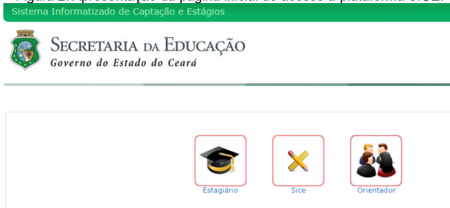
Figura 2. Apresentação da página inicial de acesso à plataforma SICE.