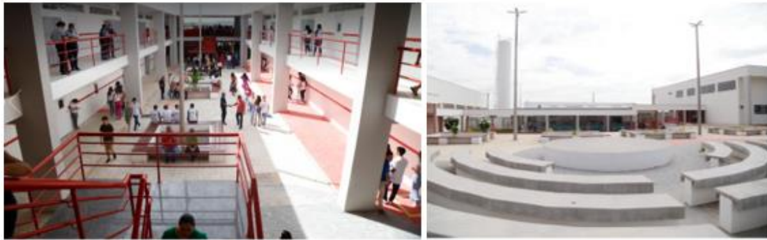
Figura 1. Inauguração de escola em Farias Brito marca abertura do ano letivo na rede estadual.